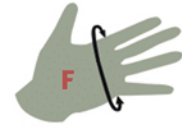
El çevrenizi ölçün